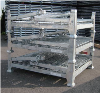
■ 折り畳み時の段積み