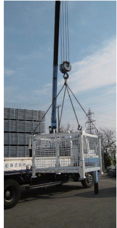
■ ユニックでの作業（イメージ）