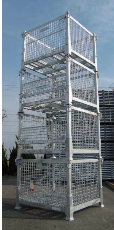
■ 段積み使用時（イメージ）