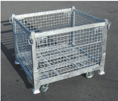
■ キャスター（オプション）を付けた状態